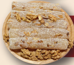
Cevizli eker ubuęu