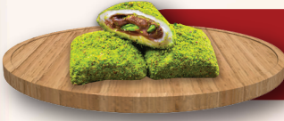
Fıstıklı Parçacıklı Bohça