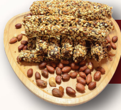
Kaysılı Fıstıklı Pirinç Fitol