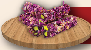
Gül Yapraklı Fitol