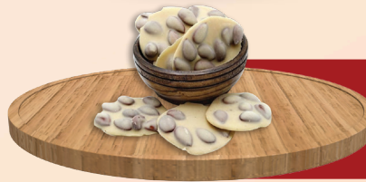
Sütlü Çekirdekli Cimikx