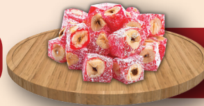
Narlı Çifte Kavrulmuş