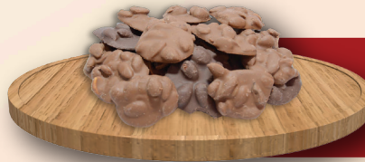
Sütlü Bitter Çekirdekli Cimikx