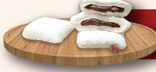
Hindistan Cevizli Bohça