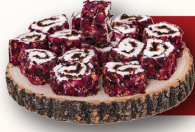
ikolatalı Gll Sarma Lokum