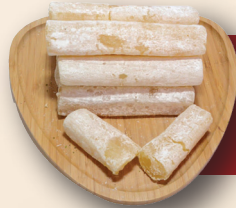
Sade eker ubuęu