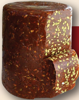
Fıstıklı Kayısı Döner