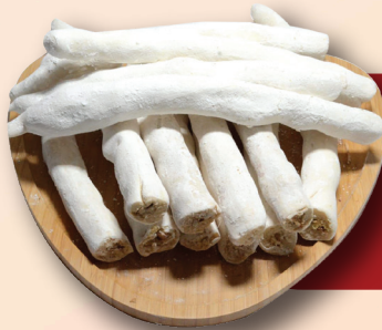
Köpüklü Cevizli Sucuk