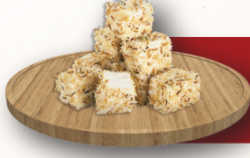
Kadayıflı Cevizli Küp Lokum