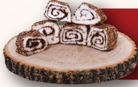
Susamlı ikolatalı Sarma