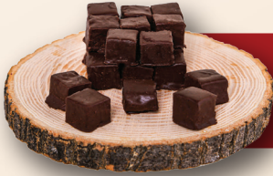
Bitter Kayısı Çikolata