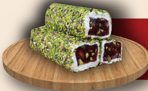
Antep Fıstıklı Pirinç Fitol