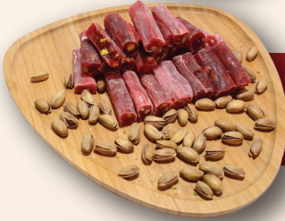
Narlı Pirinç Fitol