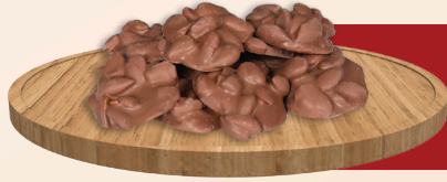
Sütlü Çikolata Cimikx