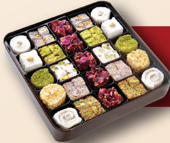
Hediyelik Karışık Lokum