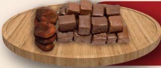
Sütlü Kayısı Çikolata