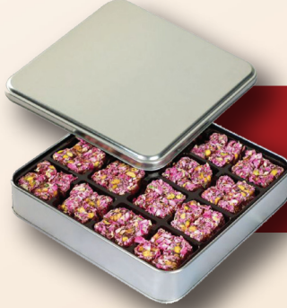
Hediyelik Fıstıklı Gül Lokumu