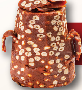
Fındıklı Kayısı Döner