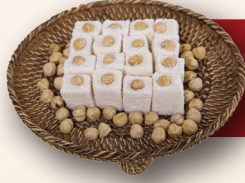
Fındıklı Sultan Lokum