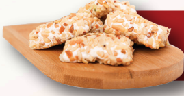
Fındıklı Parçacıklı Bohça