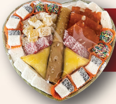
Küçük Hediyelik Tabak