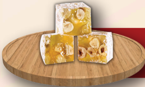
Sarı Çifte Kavrulmuş