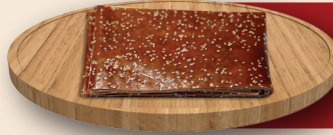
Yöresel Susamlı Pestil