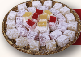
Sade Ve Güllü Lokum